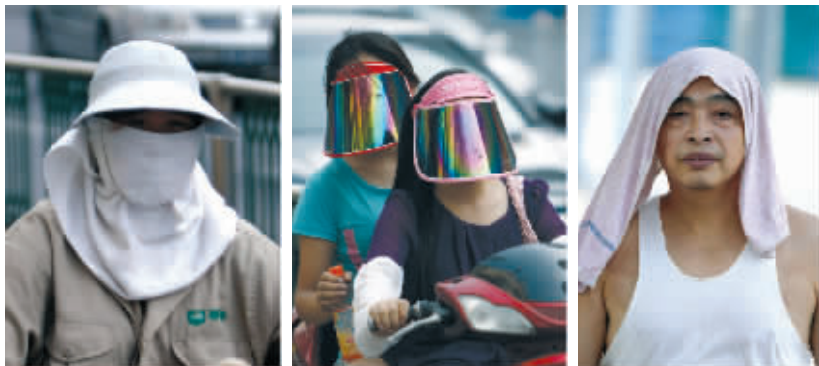
昨天,南京市民以各自不同方式躲避火辣辣的阳光

昨天,南京迎来今夏第三个高温日,最高气温创下今年最高,达到了35.9℃。省气象台也发布了今夏首个高温黄色预警。不过高温天气持续时间不会太长,27-28日以后,南京多阴雨天气,有人梅迹象。