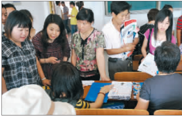
现场家长们正在向招生人员咨询相关事宜

昨日,为帮助广大考生了解招生政策,合理填报高考志愿,同时为考生提供咨询服务,160余家各层次大学在江苏工业学院举行一场高招咨询会。4层楼的招生咨询会现场挤满了考生和家长,考生们“发话”的场景不多,而家长们俨然成了咨询会的主角。