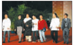
《寻找智美更登》剧组