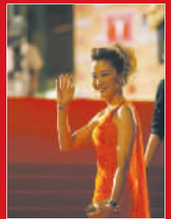
杨紫琼挥手致意兴致高