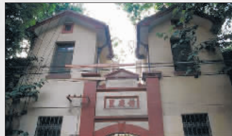
下关花家桥的锦庆里是一座旧式石库门建筑,保留完好的入口牌楼在南京已非常少见