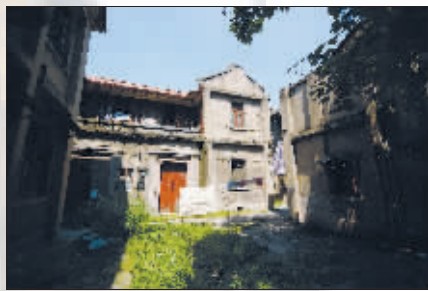
静静的桃源村,没有人知道它的历史