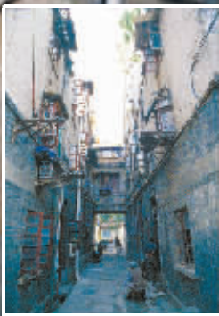
文昌巷的民国建筑