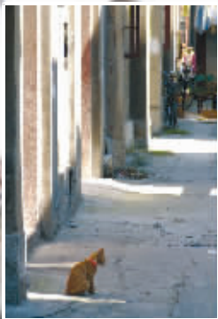
桃源村外一只悠闲的猫