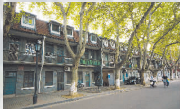
钟岚里的新式石库门建筑,保存完整,现为部队家属住宅