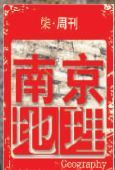
位于玄武区的桃源新村为二层联排住宅,墙面为拉毛处理

两百米,同样有一个很不起眼的小杂院,门牌为“桃源村”,但是一走入院门,立刻“别有洞天”。这里有着一座可以说是南京地区保存最好的“石库门建筑”!