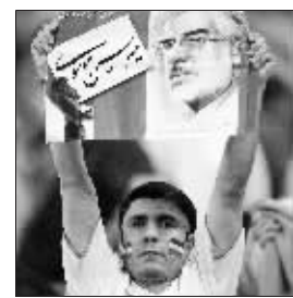
17日,在韩国首都首尔举行的2010年世界杯预选赛亚洲区十强赛韩国对伊朗的比赛中,伊朗球迷举着穆萨维海报。

现在非常明显的是,如果不能消除日益尖锐的对抗情绪,民众的抗议行动就有失控的可能,为了度过这场危机,伊朗现政权有可能被迫作出让步和调整。而这样的决定,一定只能出自最高精神领袖哈梅内伊。所以,穆萨维的挑战实际上是在迫使哈梅内伊作出一定的让步。