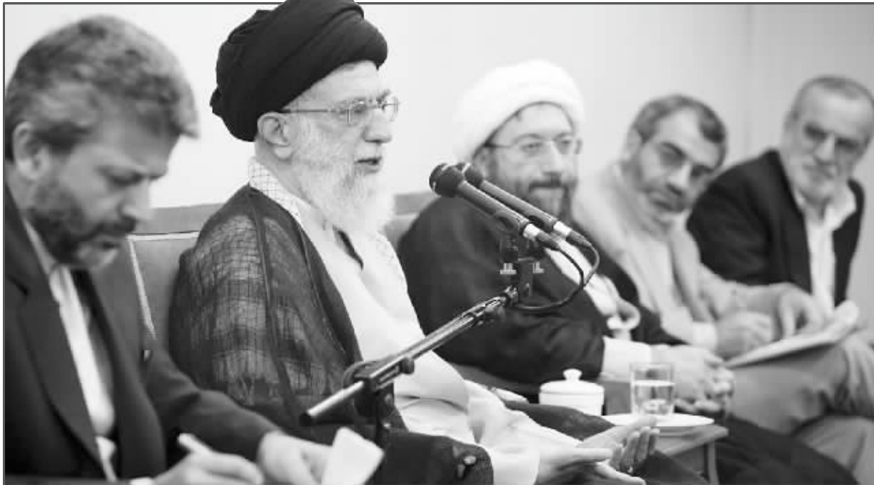
伊朗最高精神领袖阿亚图拉·阿里·哈梅内伊(左2)16日在德黑兰与四名总统候选人代表举行会谈。