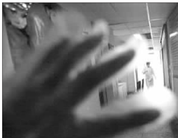
许多护士称华某爱对女同事“动手动脚”

“此人色胆包天,有夫之妇他也不放过,对女员工毛手毛脚……近期此人居然嚣张到对我老婆动手动脚,还三番五次地用言语对我老婆进行骚扰……”10日上午9点03分,一篇帖子出现在昆明信息港彩龙论坛上。发帖者“麦田麦语”倾诉了妻子的遭遇后称,他忍无可忍,决定给此人一点颜色看看,并请网友帮他出个良策。