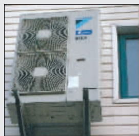
▲最好给室外机做一个遮阳罩