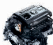
TSI 涡轮增压直列四缸发动机