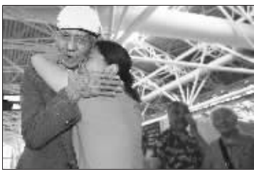
亲友紧紧拥抱着老兵