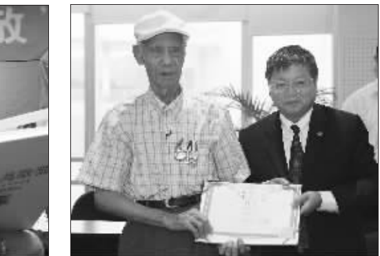
天泓总经理(右)给老兵送聘书