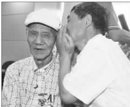
临别之际, 和老兵说悄悄话