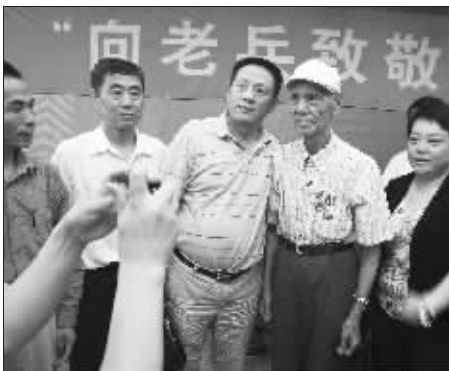
大家争着和老兵合影