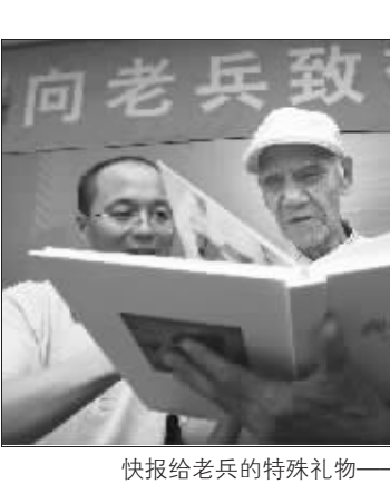
快报给老兵的特殊礼物——回乡影集