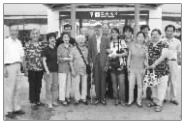
机场送别时, 拍张全家福

不过, 老人内心很清楚, 在缅甸的家, 他还是“顶梁柱”, 全家人离不开他, 他也放心不下家人, 他不得不走。