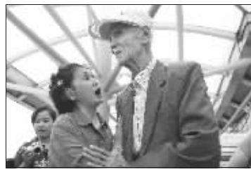
“答应我们再回来哦”