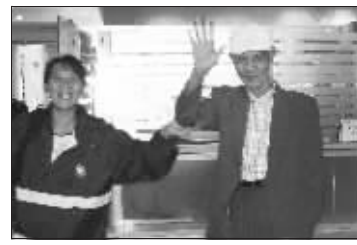
老兵和女儿在机场向大家告别