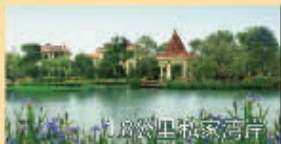
九湖湖山私家湾岸