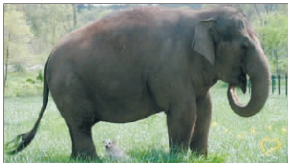
塔拉和贝拉,它们是好朋友

感情到底有多深,直到去年的一天,流浪狗贝拉的脊椎受了伤,它既无法走路,也无法摇动尾巴,而大象塔拉一直不离不弃地陪伴在贝拉的身边。