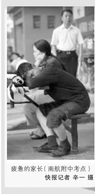
疲惫的家长(南航附中考点)