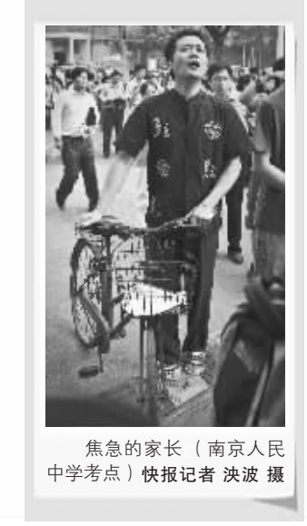
焦急的家长(南京人民中学考点)