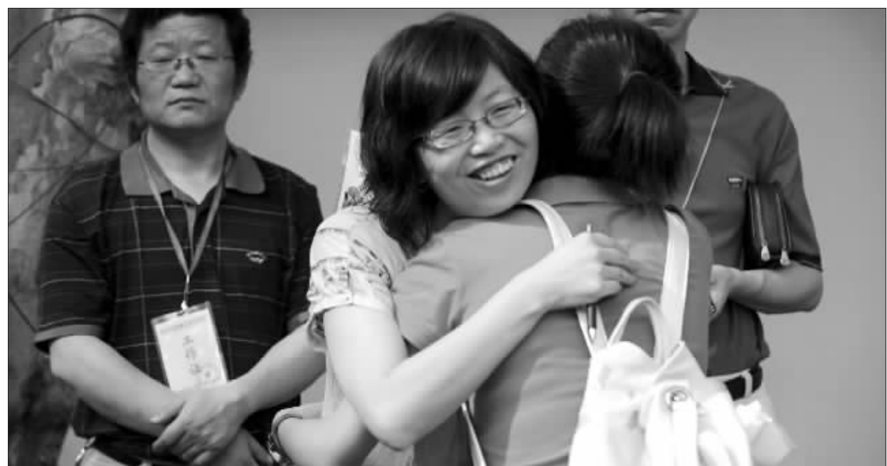
昨天早上8:00,南京金陵中学考点,一名考生和老师拥抱