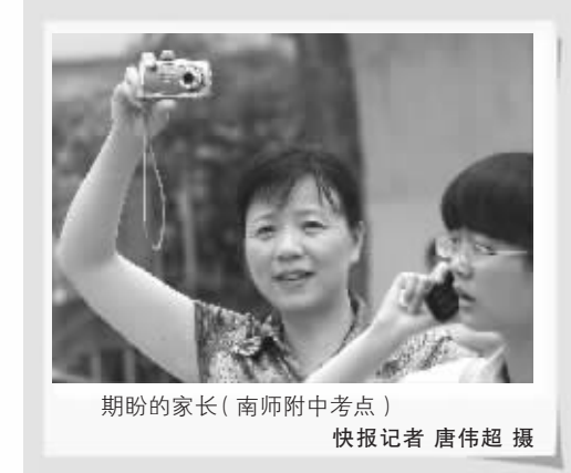
期盼的家长(南师附中考点)