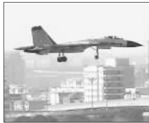
国产歼11B战机试飞 资料图片

对于外界传说的歼11B型战斗机将出现在今年的国庆60周年阅兵活动上,刘大响表示了肯定。他介绍,目前歼11B除