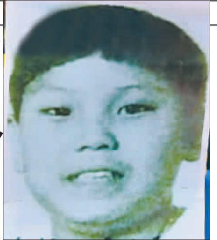
外媒流传的金正云11岁时的照片,也是外界唯一的有关他的照片。

■ 朝鲜已于5月28日向海外使领馆通报 ■ 目前正在接受军方和党内主要人物效忠 ■ 核试爆、导弹发射都是由其在后台操纵