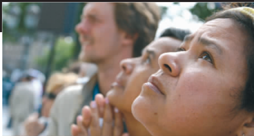
3日,巴黎圣母院为遇难者举行追悼活动

据法国媒体4日报道,法国航空公司(法航)已经向失事客机乘客的亲属证实没有希望找到生还者。