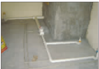
家装工程水电路改造陷阱多,消费者要睁大眼睛。(资料图片)