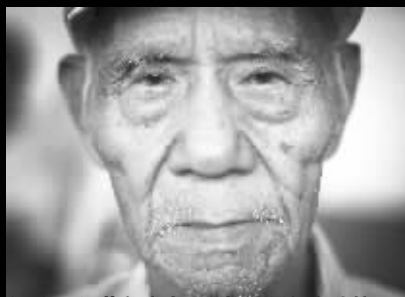
经乘国 江苏句容人 92岁 现居缅甸边境