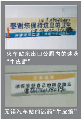
火车站东出口公厕内的迷药“牛皮癣”

同样,在无锡火车站的公共厕所内,也存在着不少的“牛皮癣”。汽车站公共厕所的大便池处,一样是在公益小广告上,有着一样的字迹,写着一样的字迹:“迷药 134****0890”。前天,《生活