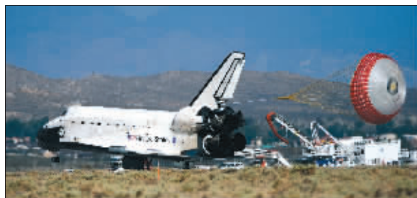
24日,“阿特兰蒂斯”号降落在爱德华兹空军基地。

美国“阿特兰蒂斯”号航天飞机在地球上空多盘旋了两天之后,24日终于安全回到地面。这架航天飞机原定22日“回家”,却受恶劣天气影响迟迟未能落地。