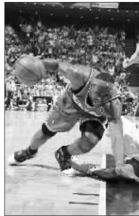
詹姆斯千万不能倒,他一倒,骑士就完了

相比之下,魔术进攻就很丰富,霍华德场均21.3分,特克格鲁场均16.3分,刘易斯场均20分,再加上皮特鲁斯场均13分和阿尔斯通场均11分,魔术比骑士得分点多得多。克里夫兰媒体抱怨:“和06-07赛季相比,我们毫无进步,还是詹姆斯一个人在打球!”当年,骑士虽然凭借詹姆斯的强势表现闯进NBA总决赛,但最终因整体作战能力不足,惨遭马刺4:0横扫。