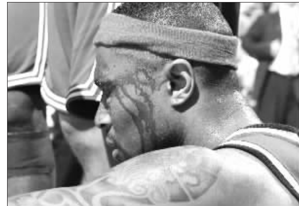
小莫受伤的部位和巴蒂尔类似