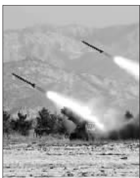
朝鲜今年进行实弹演习的资料照片。

朝鲜25日实施一次地下核试验。这是朝鲜第二次实施此类试验。朝鲜中央通讯社报道,试验取得“成功”,核爆炸威力“比前一次更大”,试验目的是增强朝鲜自卫核威慑能力。韩国方面称,朝鲜随后又发射了3枚地对空短程导弹。