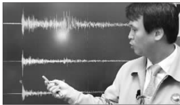
5月25日,一名韩国国家地震中心的工作人员向媒体解释韩方监测到的朝鲜地下核试验产生的“人工地震波”。

延吉市十中的一位老师告诉记者,事发时,学校正在给学生上课,她正在教导处备课,忽然感到她的桌子晃了一下。她还以为是对面的同事在和她开玩笑故意晃的,哪知,那