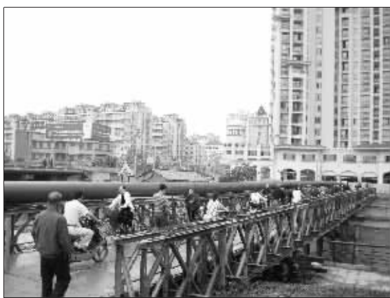
红菱桥施工期间机动车需绕行

另据了解,以红菱桥为节点的飞龙东路将于5月下旬和6月上旬开始大面积施工,有关部门已作出提醒,建议机动车不要驶入该施工地段,如确需通过该路段出行,最好使用非机动车或步行进出。