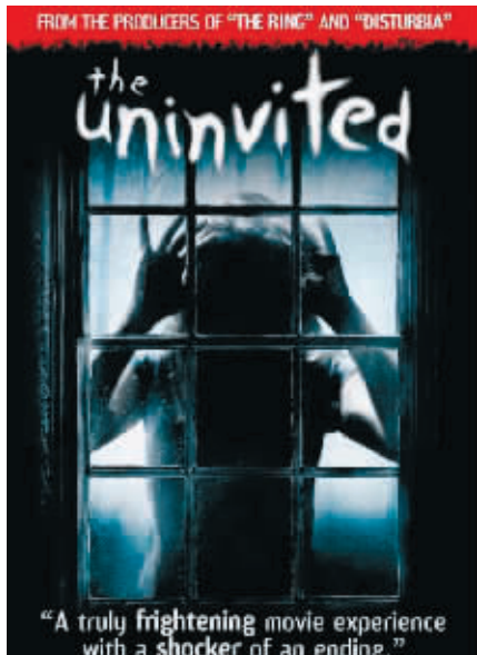
合格改编的普通电影