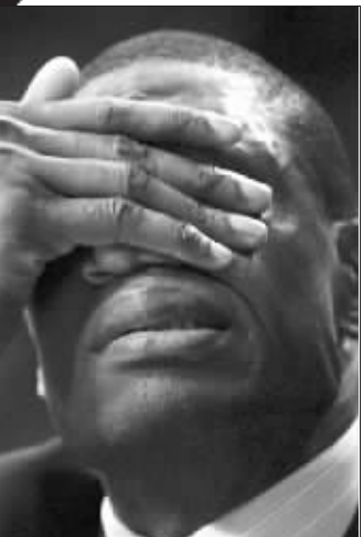
难道大掉泪也是演戏?

“现在火箭主场俨然是中国主场,遍布中国厂商的广告,还有众多在电视上打广告的合作伙, NBA只有让他们在利益得到最大化,来年才可以吸引到更多、更有钱的赞助商来投资NBA。联盟的用心不言而喻。”这位评论员说。