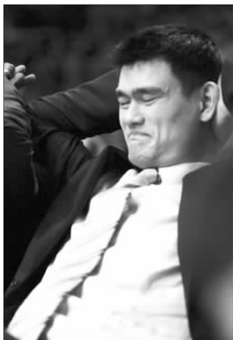
姚明对火箭惨败已不忍直视

当打破季后赛首轮魔咒已成历史,当出局的最终结果摆在火箭面前,火箭不可避免地迎来了“秋后算账”的现实——未来姚明将何去何从,未来火箭将走向何方?