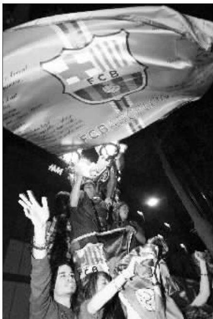
巴萨球迷也疯狂了

不过巴萨夺冠也有不和谐的声音,得知球队夺冠后,数以万计的巴萨球迷走出家门,来到加泰罗尼亚广场庆祝。结果球迷和警察发生冲突,最终有63名闹事者被逮捕。