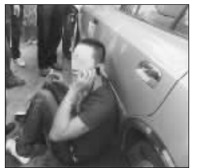
肇事司机在不停地打电话

昨天上午,一辆银色伊兰特轿车在节制闸路突然冲到对面车道,将一名行人撞飞五六米后,又导致停在人行道上三辆汽车连环相撞。