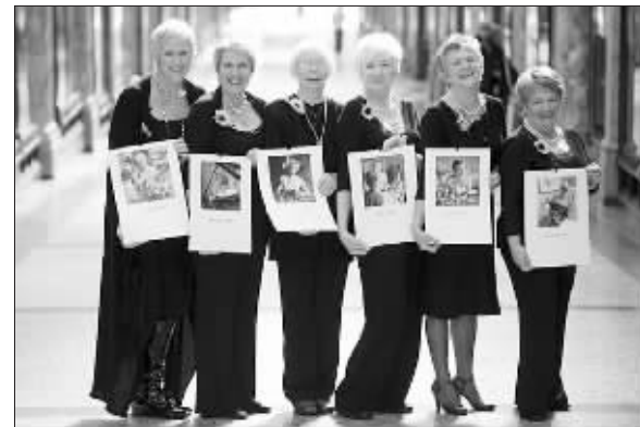
六名老妇人站在一起

10年前,11名英国妇女为了募集善款,拍摄了一组裸体照片制作成挂历。如今,多数已过耳顺之年的这些妇女中的6人再次“披挂上阵”,拍摄下2010年的裸体挂历,实际上她们所“披挂”的,除了一些珍珠饰品和花朵外,就是灿烂的笑容。