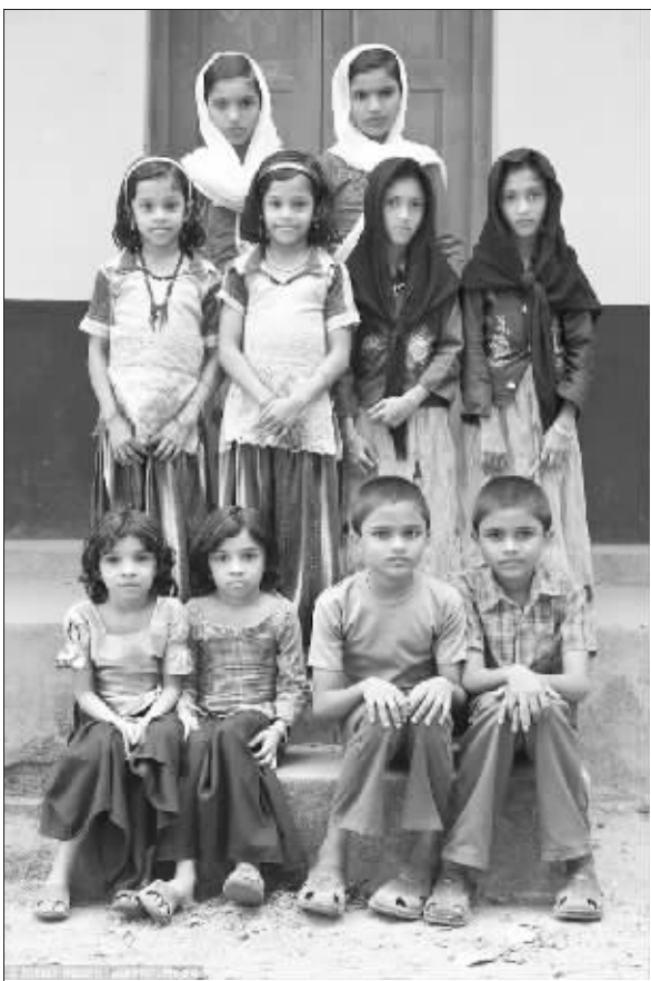
科丁西村中的双胞胎们