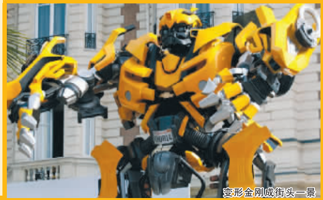
变形金刚街头一景