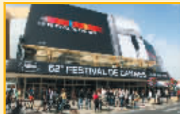
整座城市充满电影味道

克斯年度动画大作《飞屋环游记》。这是一个“超越死亡的爱情故事”,动画历史上有过这样的作品吗?《时代》杂志称其有“电影历史上最甜蜜,最让人伤感的4分半钟”。 宗和