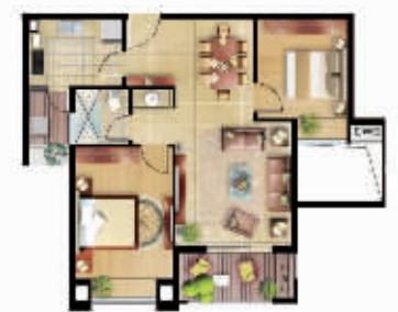
两房两厅一厨一卫