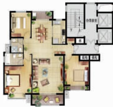
三房两厅一厨一卫

想在江北可能出清全面涨价之前,现代快报为买房人争取到威尼斯水城的团购良机,还有房源,所有户型,现场优惠基础上,再享9.8折优惠,赶紧行动起来!