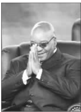
祖马在宣誓就职前坐在办公室内

南非当选总统雅各布·祖马9日在比勒陀利亚宣誓就职,超过30位来自世界各地的政府和国家首脑前来参加祖马就职仪式,其中尤以非洲领导人为主,仿若小型非洲联盟峰会。祖马就职时,身边陪伴着他的第一位妻子西扎克莱·库马洛。