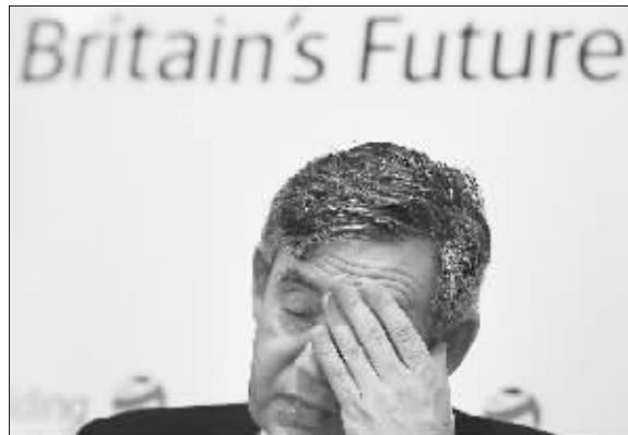
布朗的表情流露出内外交困的疲惫