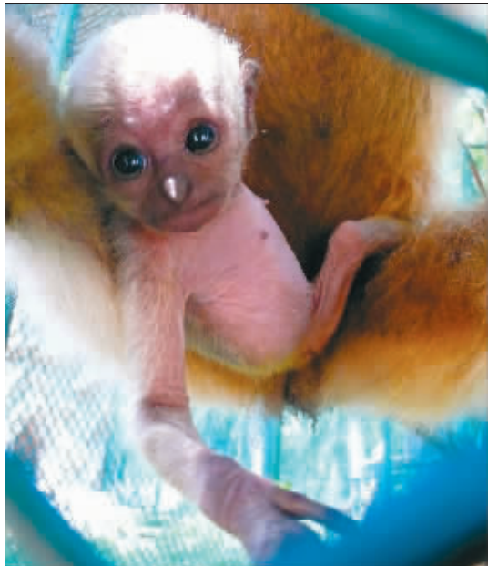
猿宝宝头小眼大,很像外星人

红山动物园的长臂猿家族最近又添喜,模范猿妈“二黄”生下了第二个宝宝。俗话说,一回生,二回熟,对于怎样带好孩子,“二黄”已经很有经验了。这不,为了防止宝宝发生意外,这个好妈妈几乎24小时抱着自己的宝宝不离手。才20多天的宝宝在爸爸妈妈的细心呵护下,慢慢学会了攀爬,偶尔还会奶声奶气地唱上几段“猿歌”,过上了幸福的童年生活。