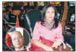
老公打电动,老婆陪伴