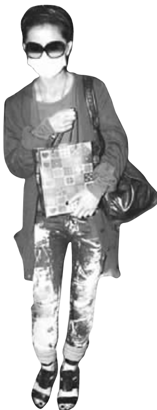
▲阿Sa戴口罩、勤洗手严防病毒