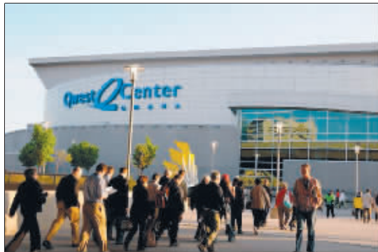
伯克希尔·哈撒韦的股东陆续走进会场