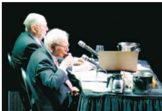
巴菲特在发言间隙饮用他最喜爱的可口可乐