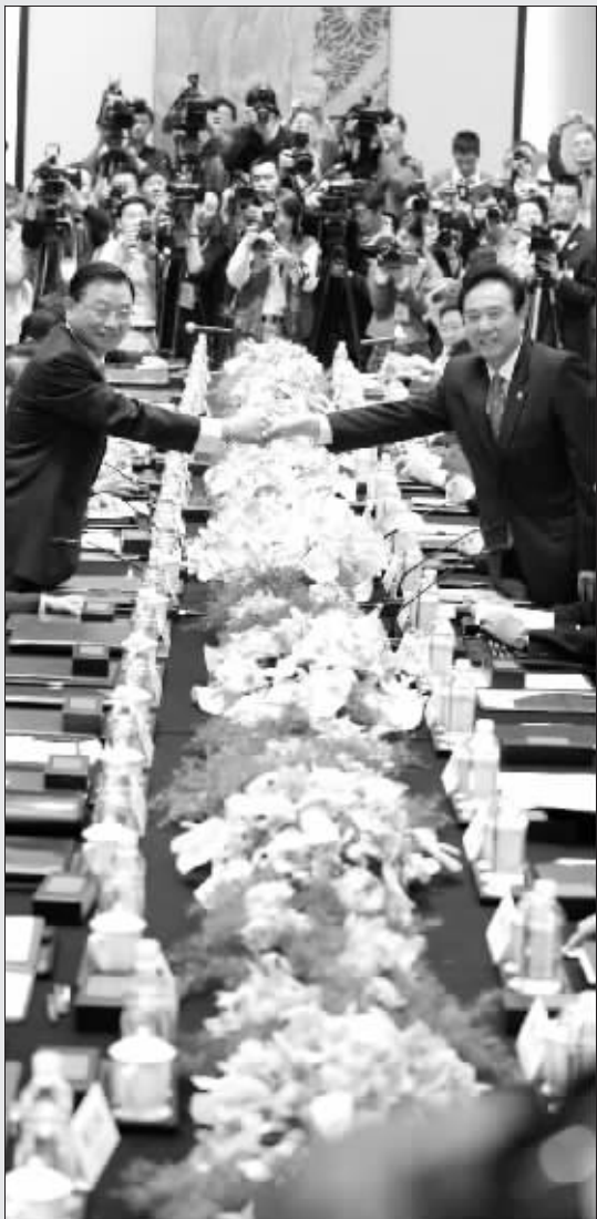
“陈江会谈”的经典握手