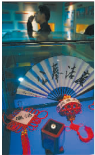
展出的廉政扇

作为江苏首个“廉政文化教育馆”,里面究竟藏着什么宝贝?记者昨日先行前往探秘,从古代的城砖、碑刻,到现代的廉政茶杯、廉政扇,展馆里展示了500多件实物、近千张图片,汇聚了古今中外的种种廉政逸事。