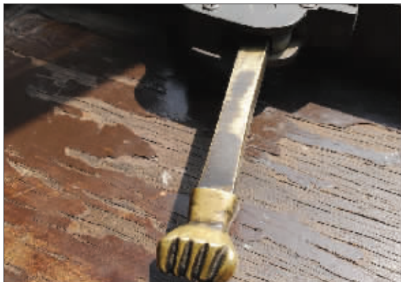
快报记者 路军 摄于总统府

大千世界,无奇不有,人类的想象力和创造力永无止境。从本期起,发现周刊将为您推出此互动栏目,图片中展示的是古今中外的人类发明、奇器大巧和自然景物,根据图片的冰山一角,您能猜出它是什么吗?将您的答案和联系方式邮寄至:南京市洪武北路55号置地广场6楼,邮编:210005,或发送至邮箱:keke0001@gmail.com,或登录博客:http://keke0001.blog.sohu.com。如果答对,会有惊喜哦!答案将在下期公布。