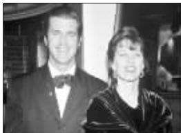
梅尔夫妇的婚姻持续了 28 年

此外,据报道罗比(梅尔之妻)2006 年与梅尔分开后,3 年来一直偷偷以自己的名义购买多幢物业,看来她早已为自己的将来打算了。