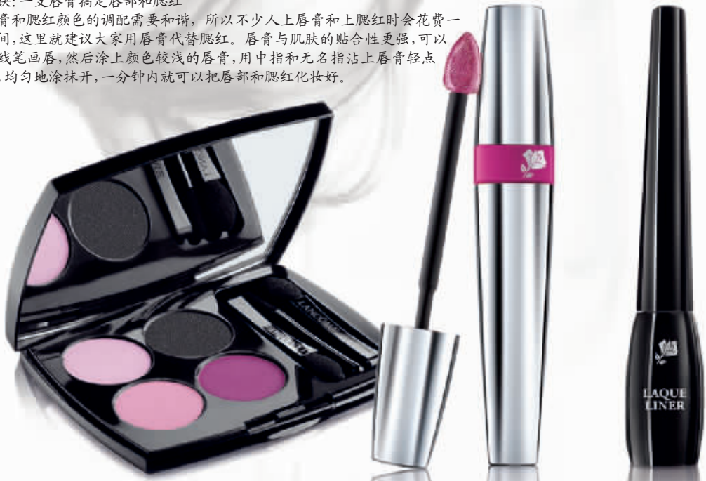
Pink Punk and Black Palette 兰蔻粉红不羁四色眼影 RMB 495