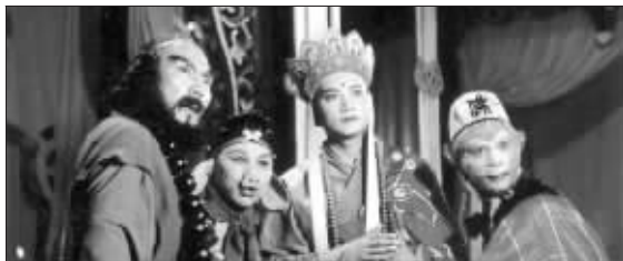
“师徒”四人感情深厚