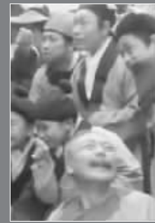
围观孙悟空的老者