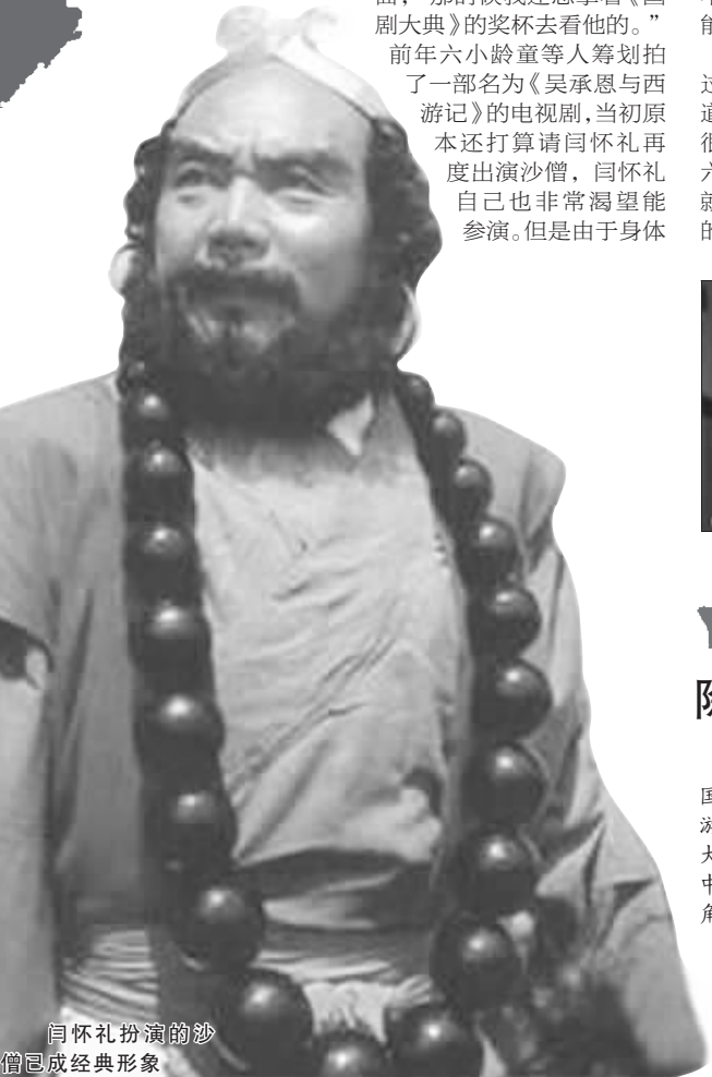
闫怀礼扮演的沙僧已成经典形象