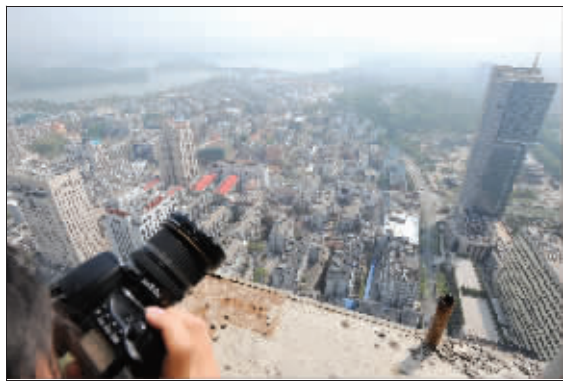
昨天,站在紫峰大厦俯瞰南京城,完全是另一种感觉

地下4层主要用作停车,可容纳1000辆机动车和3000辆非机动车;一楼是办公大堂、酒店大堂、宴会厅大堂、购物中心首层;2-5层主要是购物中心;6层是购物中心、电影院、宴会厅;7层是电影院、会议厅、宴会厅;8层是健身中心、游泳池、室外花园;9层是SPA;10-41层是超5A级写字楼;42-81层是六星级洲际酒店;82层是绿地MOUNT俱乐部;83-89层是配套设施。