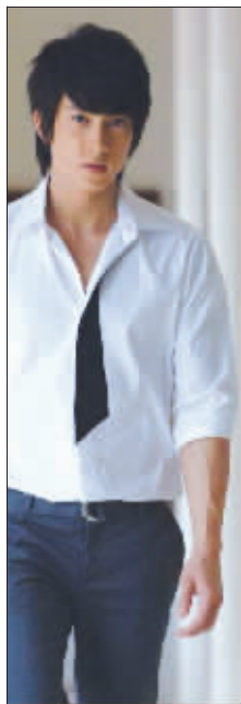
吴尊太帅也成了缺点

在网友的投票中,几乎近40%觉得韩国影星金喜善、李英爱是具有白娘子相的明星。网友“阿罗”说:“赵雅芝之所以把白娘子演得如此出神入化,是因为她身上有一股让人非常舒服温温柔柔的亲和力,而且古装扮相十分唯美。在现在明星中只有金喜善和李英爱拥有这样的气质,而且她们的古装扮相也十分讨巧。” 潘莎莎