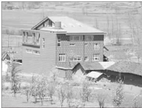
“游心楼”公益图书馆

当城里的孩子享受着网络时代海量的信息时,在云南昭通的一些地方,孩子们还在为读不到课外书发愁。看到这样的一位从云南昭通山区走出的画家决定创办一座民间性质的纯公益图书馆,让山里的孩子们也能畅游书的海洋。现在,图书馆建好了,就等着书来充实它。昨日这位曾在锡居住的画家和几个志同道合的朋友发出倡议,希望锡城市民把多余的书捐出来。