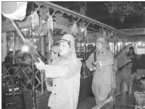
身穿抗战时期日军军装的“演员”

本市锡澄路上前段时间开了一家饭店,名字叫做“红太阳”,里面的服务员一律穿着军绿色制服、佩戴“红卫兵”袖章,晚上吃饭还有长达2个小时的“红色歌曲”演出,其间甚至还有穿着抗日战争时期日军军服的演员扛着刺刀在席间穿梭表演。如此怪异的场景引来不小争议,近日数位读者来电抗议,认为如此表演伤害了他们的感情。