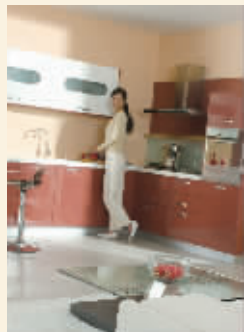
志邦米兰印象橱柜

还有三天,由现代快报和南京市装饰行业协会主办的第二届南京品牌厨卫博览会就要开幕了。由于橱柜差不多是家装工程中的首动项目,从选择、设计、下单到安装,差不多要提前两个月的时间,想赶在梅雨季节来临前结束家装的业主,到快报厨卫展上定制一套合适的橱柜是最恰当不过的了。本期《居家》为您详细介绍挑选橱柜的各个流程,以供参考。