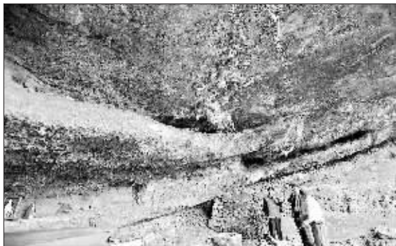
据说石泉寺附近有人挖出过东西