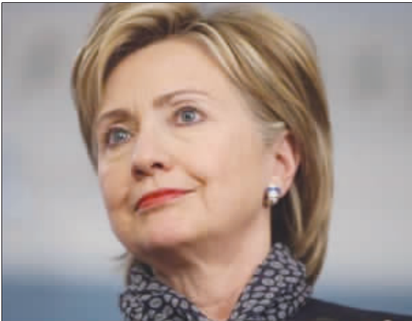
希拉里:我真冤枉! (设计台词)

“我们今天有许多事情要处理。”在法新社记者追问下,菲托尔回答:我从未拨打你们说的那个号码,如果你们想打,请利用闲暇时间。”