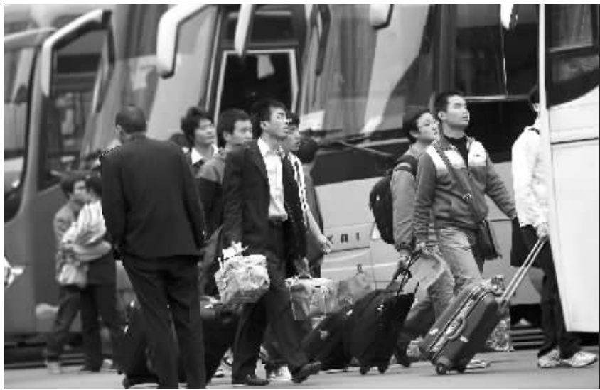
旅客赶着小长假匆匆出行

快报讯(通讯员 赵根华 记者 毛丽萍)今天就是清明节了,随着南京各大专院校提前放假,家住外地的学子集中返乡,昨天南京公路、铁路客运均迎来了最高峰。火车站南京到武汉动车票早就卖光了,就近的沪宁线、南通等线路也“一票难求”。