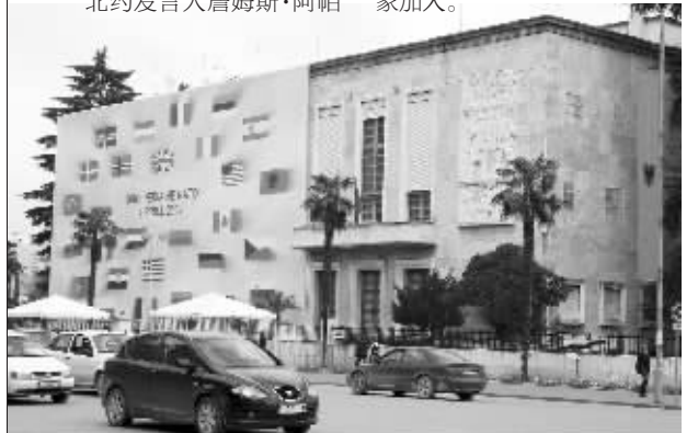
位于阿尔巴尼亚首都地拉那的阿总理府外墙披上宣传幕布,上面显示阿即将加入北约的时间以及北约成员国的国旗。

北约成立于1949年,创始国为12个。北约最大的一次扩大完成于2004年,共有7个国家加入。