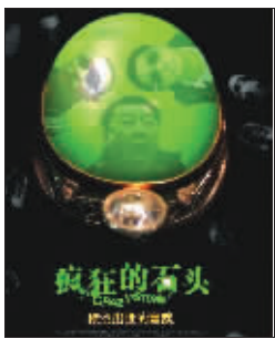
为救票房“石头”重出影市

2009年伊始，《赤壁(下)》《喜羊羊与灰太狼》等影片让南京各大影院热闹非凡，买票的观众从售票处一直排到影院门口，这已经成为影院的一大景观。不过，这种热闹景象最近却见不到了。记者获悉，自从2月底开始，南京各家电影院票房逐渐下滑，到现在也没有明显起色。新街口国际影城的崔经理告诉记者，他感觉从2月底到现在票房一直都没火爆起来。去年同期，该影院上映的电影有《见龙卸甲》《国家宝藏》《江山美人》《双食记》《冈拉梅朵》等，相比之下，今年的电影显得强劲得多，无论是《贫民窟的百万富翁》还是《东邪西毒终极版》都是极具口碑的好片，此外《刺杀希特勒》等也有汤姆·克鲁斯这样的大牌明星吸引眼球。但就在这家影院，去年同期的票房大约是255万，今年的票房不增反减，下降了40多万。而这家公司票房好的时候，一个月能做400多万，几乎场场爆满。同属新街口黄金地段的工人影城的欧阳经理也表示，该影院今年的票房成绩比去年同期下降了30%。