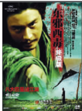
《东邪西毒终极版》海报