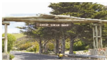
大洋路是一项叹为观止的世界奇观,是自驾游者体验飞驰快感的理想之选。

沿途奇景迭现,有惊涛拍浪的断崖,有鸟语花香的雨林,有风景优美的海湾,有蜿蜒曲折的海岸线,更有错落的巨岩,这一切的一切形成了鬼斧神工造就的人间仙境。